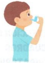
Forma incorrecta del uso de inhalador