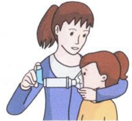
Forma correcta del uso de inhalador en niños, niñas y jóvenes